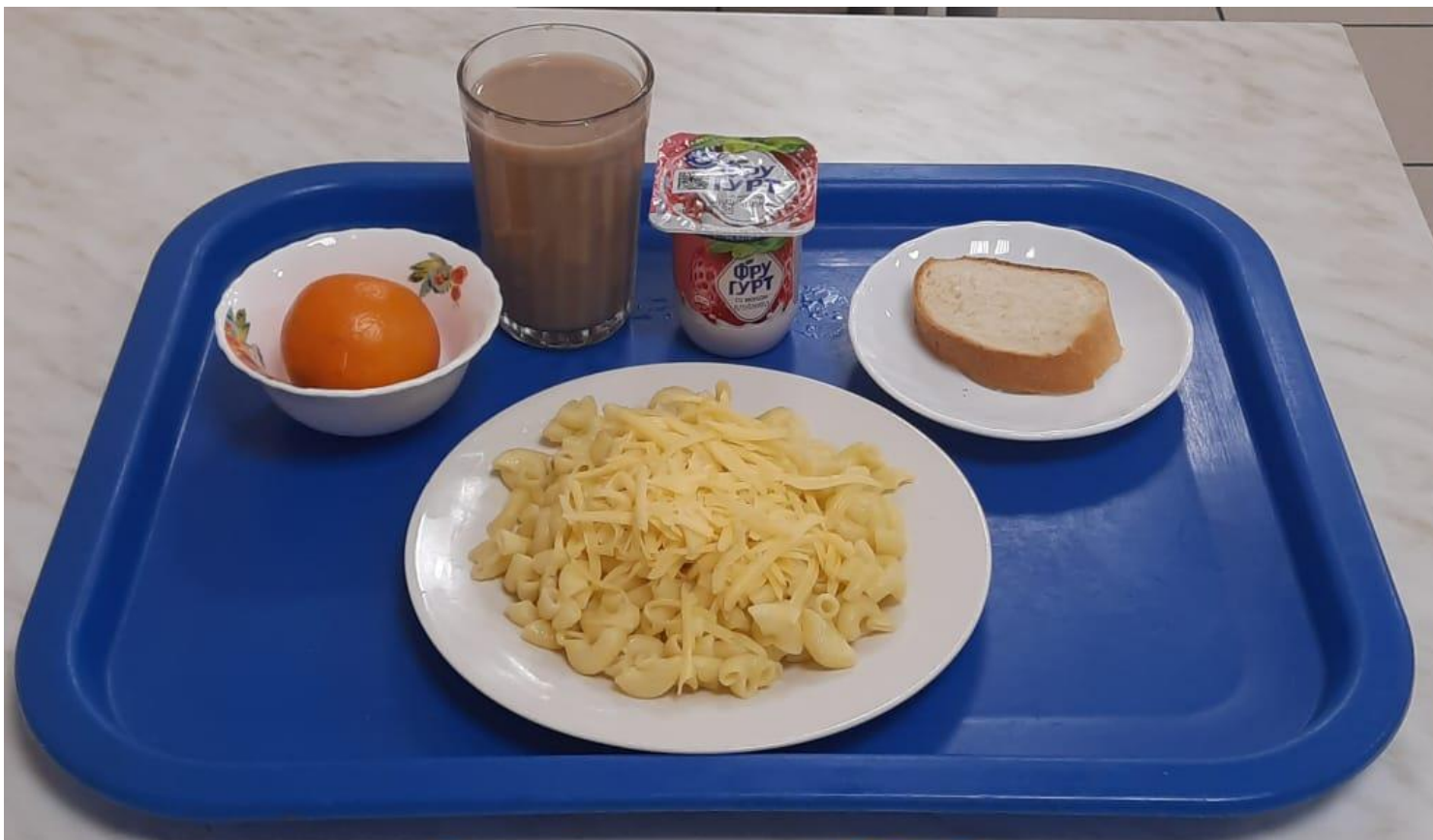
Завтрак N 2. с 1-4 кл.