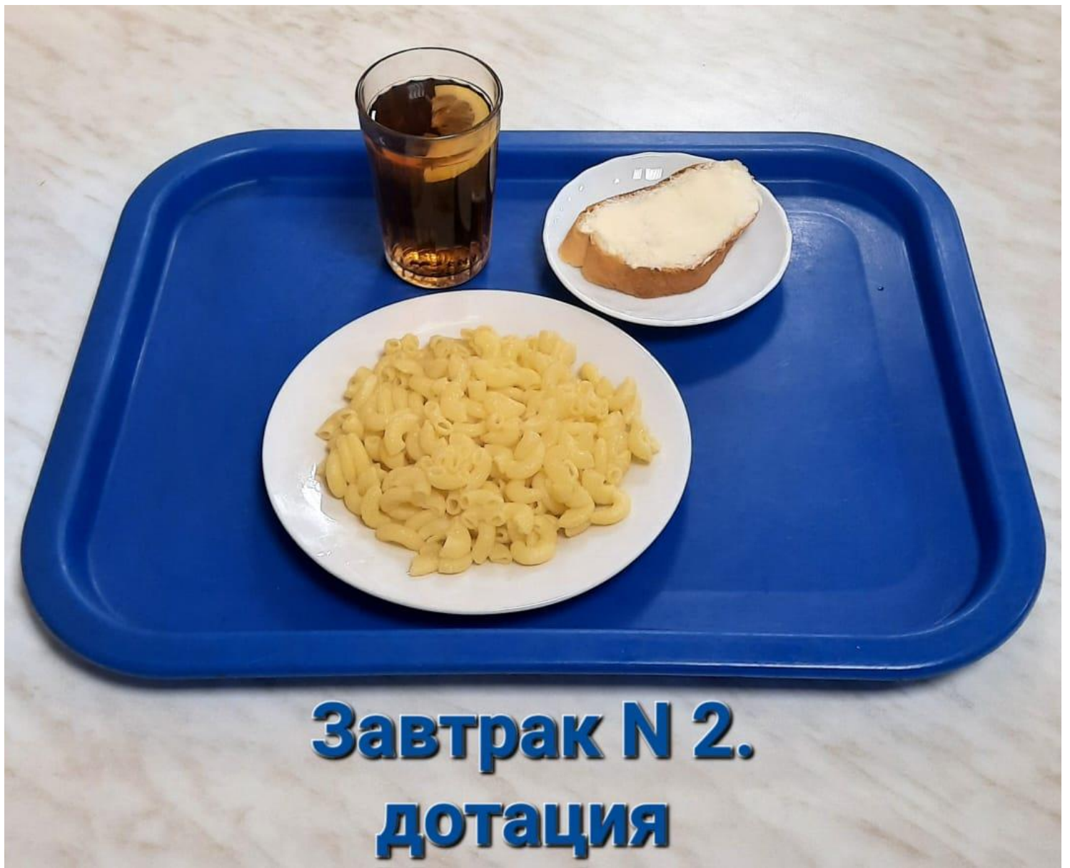
Завтрак N 2. ДОТАЦИЯ