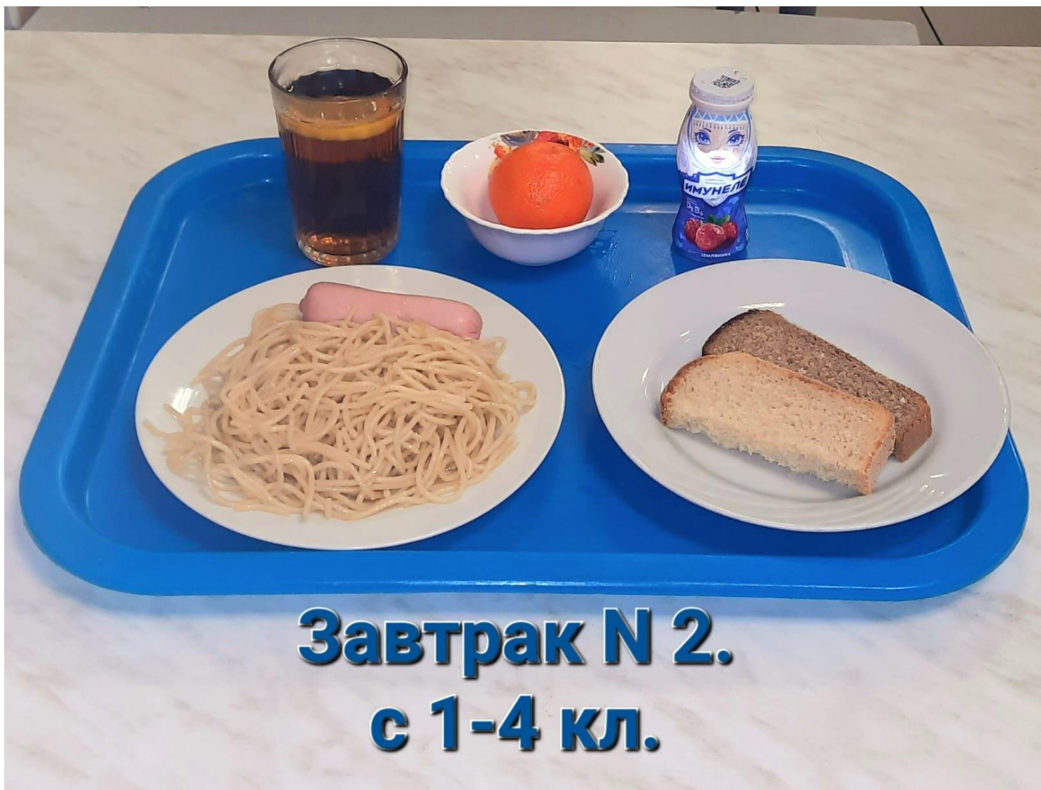
Завтрак N 2. с 1-4 кл.