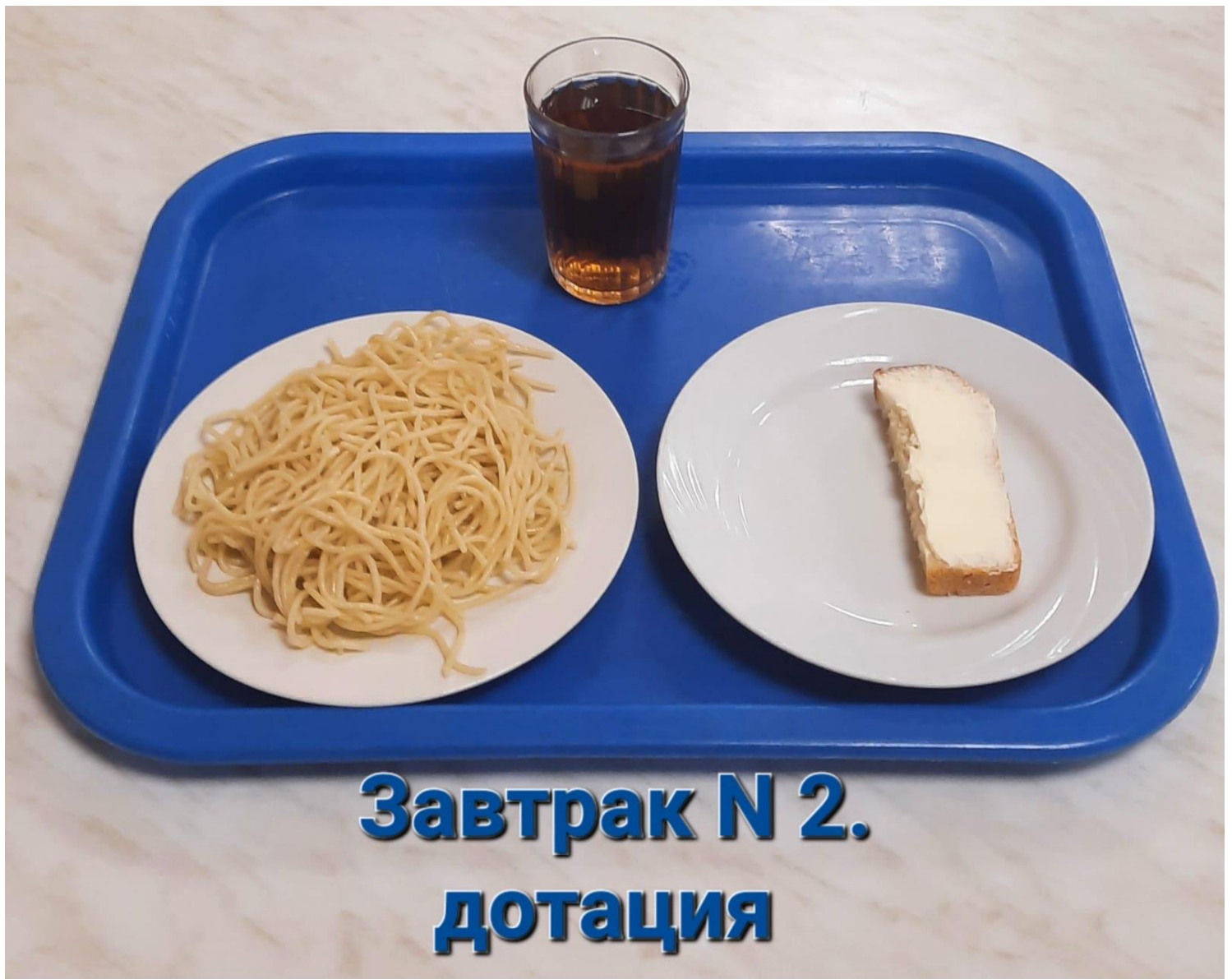
Завтрак N 2. ДОТАЦИЯ