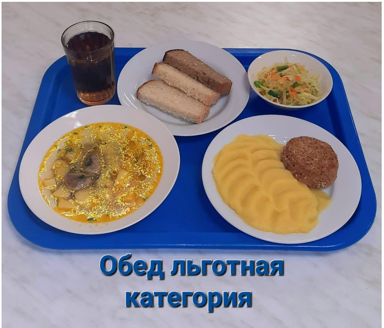
Обед льготная категория