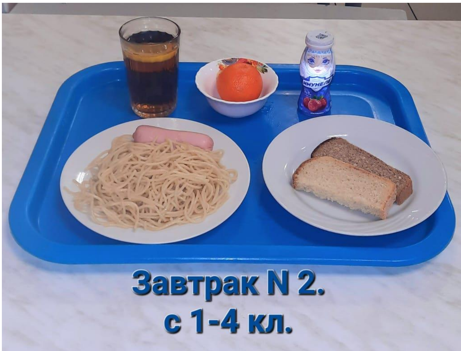
Завтрак N 2. с 1-4 кл.