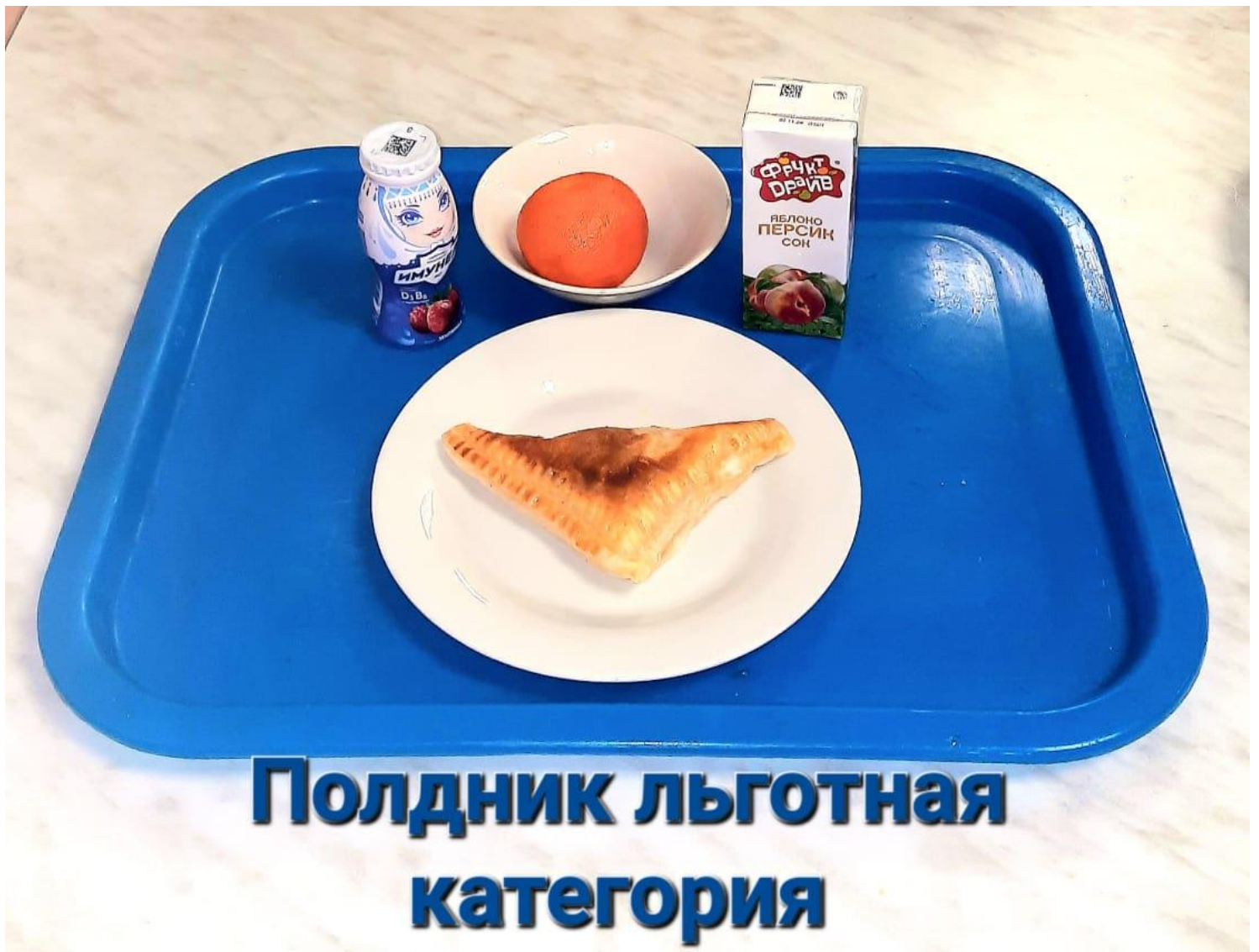
Полдник льготная категория